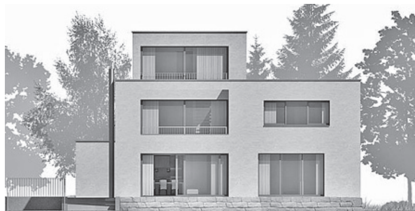
Zweifamilienhaus in Holz: Baujahr 2011, Minergie-P Zertifikat BS-17-P.

nachhaltigen Holzarchitektur: sehr ökologisch und ressourcenschonend bauen und dabei ganz selbstverständlich auch die Wohnqualität steigern und das Raumklima entscheidend verbessern. Wertbeständigkeit und ein gesundes Raumklima spielen bei unseren Bauvorhaben optimal zusammen, denn wir denken ökonomisch und handeln genau aus diesem Grund ökologisch. In unserem Architekturverständnis ist die Natur integraler Bestandteil eines urbanen, zukunftsorientierten Lebensraumes und Lebensstils. Nicht nur die Wolken, die Sonne, die Pflanzen der Umgebung sind Teil dieser sinnlich erfahrbaren Erlebniswelt, sondern insbesondere das Gebäude selber mit seinen natürlichen, nachwachsenden Baustoffen und Konstruktionsmaterialien.